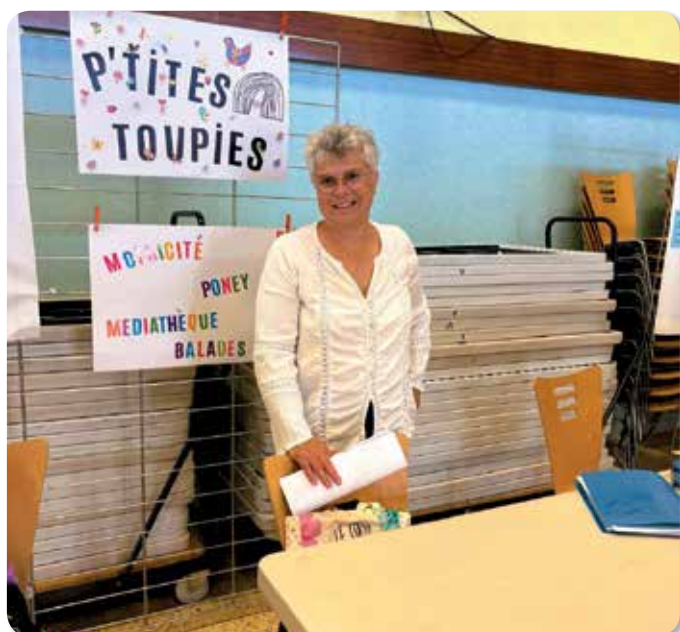
Les P'tites Toupies