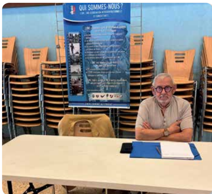
UNC Val Saint Pierre