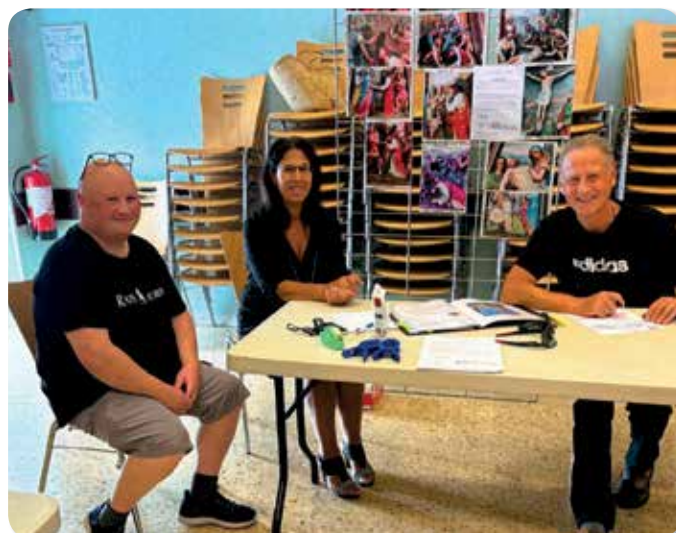
Conseil de Fabrique